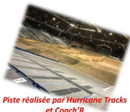
Piste réalisée par Hurricane Tracks et Coach'R